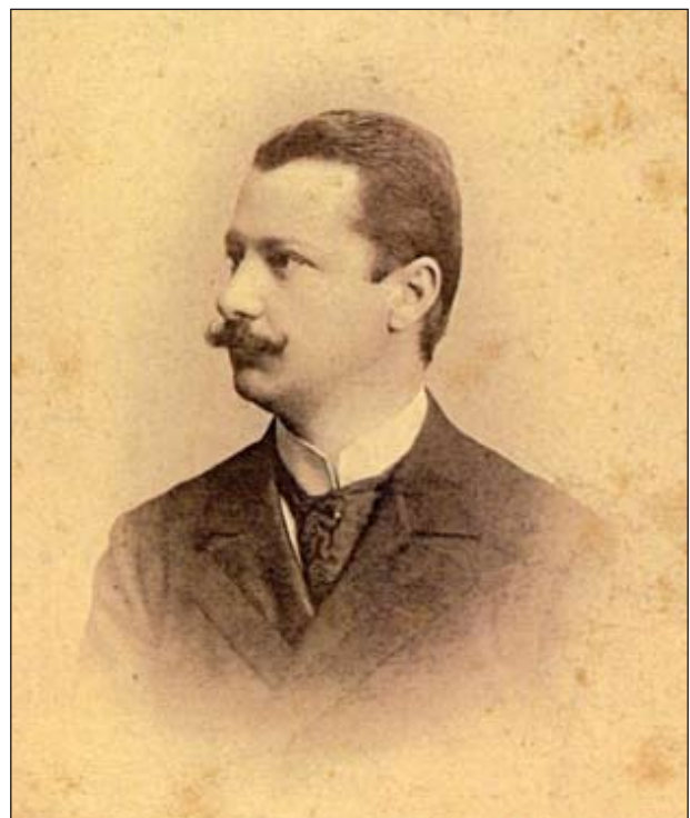
СЛИКА 1. Др Платон Папакостопулос (1864–1915)

Као санитетски мајор српске војске учествовао је у балканским ратовима и у Првом светском рату. Умро је на дужности управника Војне болнице у Ђевђелији од пегавог тифуса 19. фебруара 1915. године [7-9].