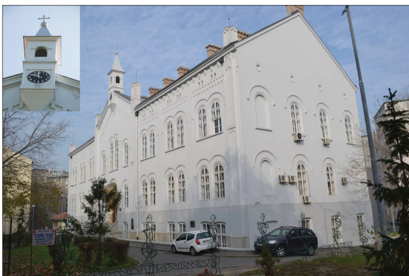
Слика 2. Седиште Српског лекарског друштва од 1990. године (зграда бивше Болнице округа и вароши Београда изграђена 1868. године) у Видинској улици, данас улици Џорџа Вашингтона 19. У горњем левом углу кула са обновљеним сатом.

Пошто и поред свих покушаја и напора (о чему у Друштву постоји потпуна документација) садашња Управа Српског лекарског друштва није успела да поврати ама баш ништа од национализацијом и узурпацијом отете му имовине и задужбина остављених му на старање, пред свим будућим руководиоцима Српског лекарског друштва стоји света обавеза да не престану да се боре да се Друштву све отето врати, чиме би бар делом била исправљена нечувена историјска неправда која је њему и његовим задужбинарима нанета и даље се наноси, без икакве њихове кривице.